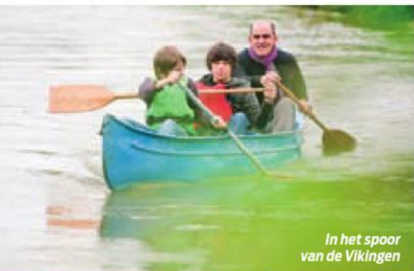
In het spoor van de Vikingen