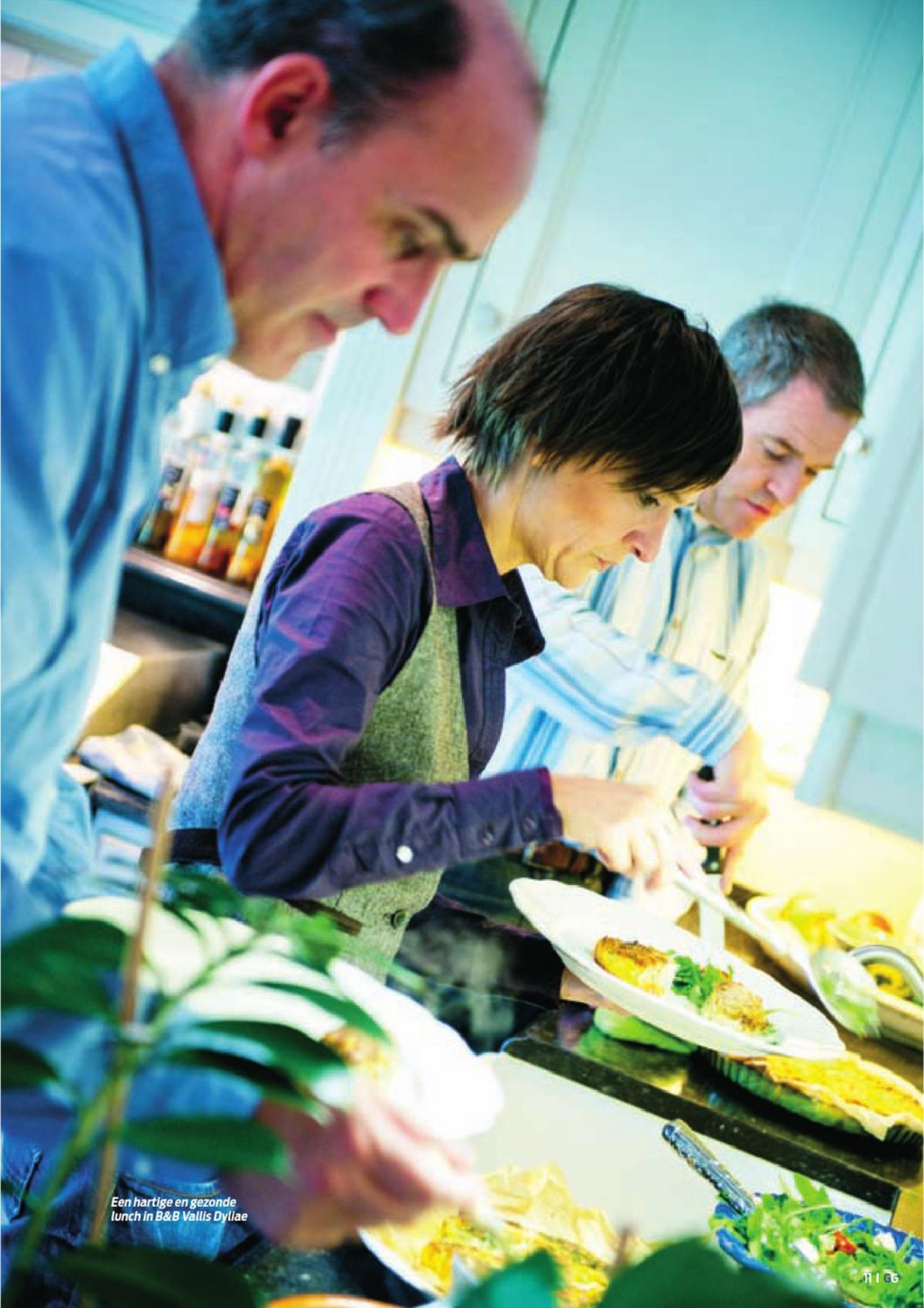
Een hartige en gezonde lunch in B&B Vallis Dyllae