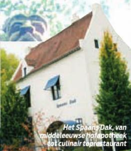
Het Spaans Dak, van middeleeuwse hofapotheek tot culinair toprestaurant