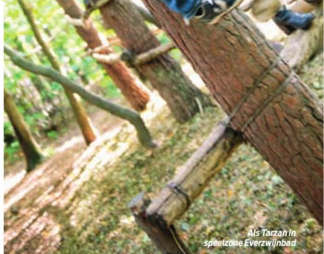
Als Tarzan in speelzone Everzwijnbad