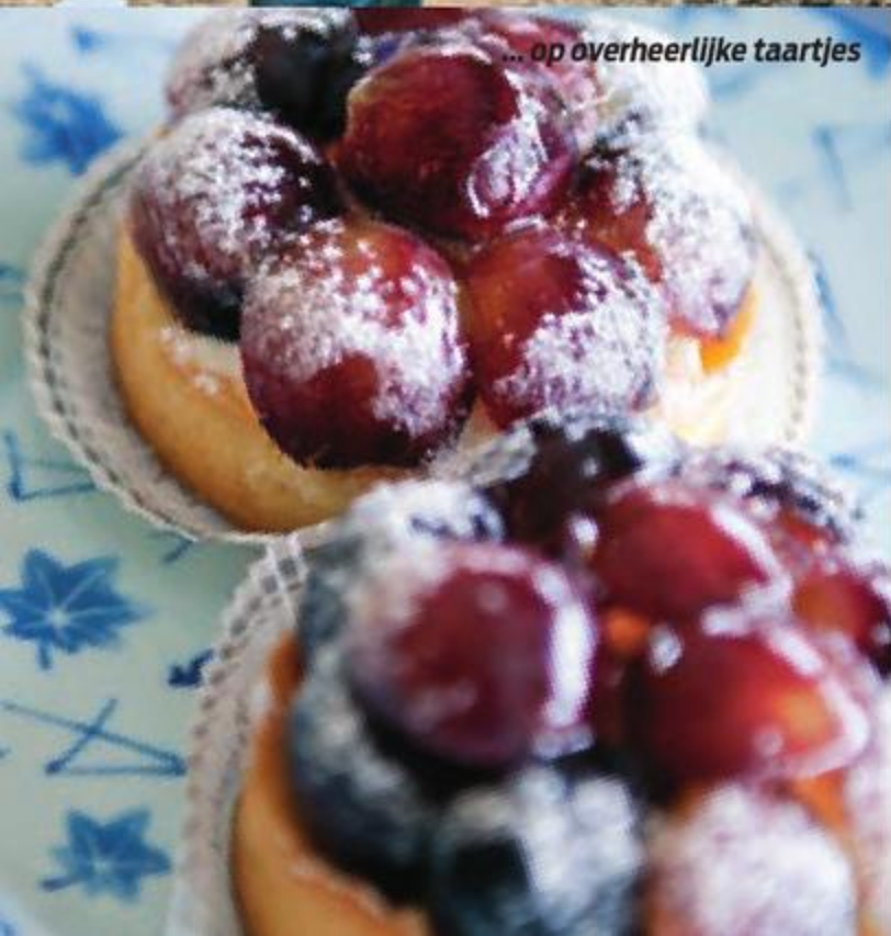
... op overheerlijke taartjes