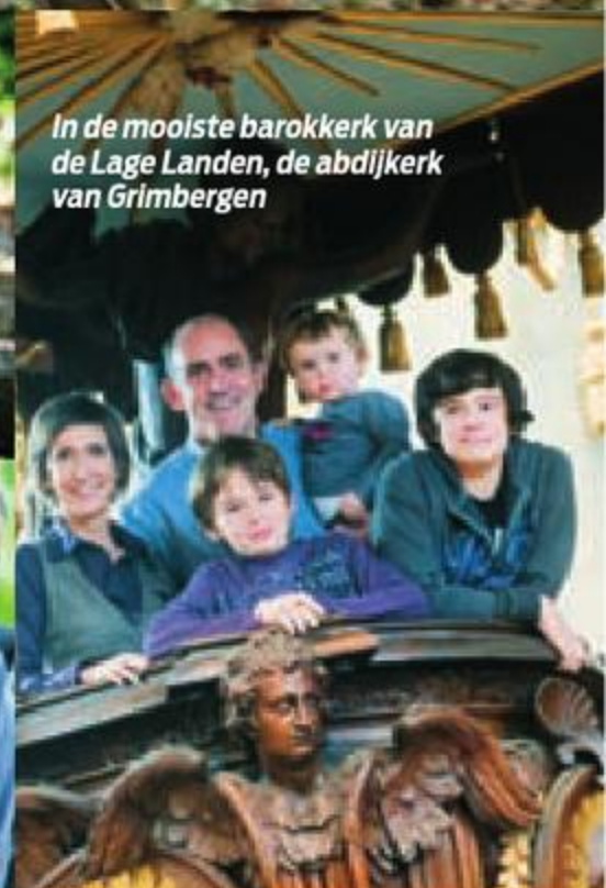
In de mooiste barokkerk van de Lage Landen, de abdijkerk van Grimbergen