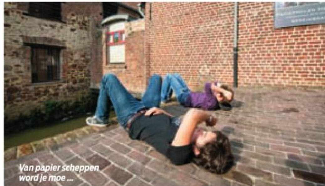
Van papler scheppen word je moe ...