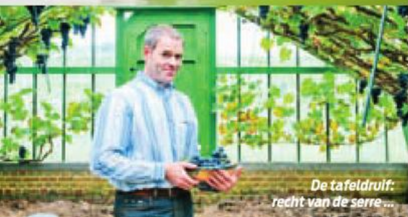
De tafeldruif: recht van de serre ...